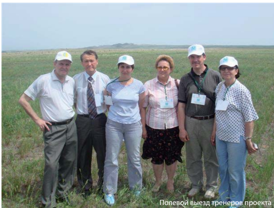
Полевой выезд тренеров проекта

Цель проводимых мероприятий – восстановление экологического потенциала деградированных пастбищ за счет обеспечения оптимальных нагрузок выпаса и обеспечение скота качественными кормами. Выбор местных общин проводился в различных природно-климатических зонах и областях Казахстана: Акмолинская, Карагандинская (засушливая зона), Алматинская (пустынь