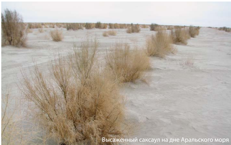
Высаженный саксаул на дне Аральского моря

В середине прошлого века площадь Арала с островами составляла 64,5 тысячи квадратных километров. Водоем по объему был четвертым в мире, за что и назван Аральским морем. Теперь оно переместилось в третью десятку и разделилось на три акватории. Площадь осушенного дна приближается к пяти миллионам гектаров. Ежегодно отсюда выносятся более ста миллионов тонн соли, пыли и песка, усиливая опустынивание и деградацию земель в Приаралье. Лесомелиорация позволяет в значительной степени смягчить этот процесс.