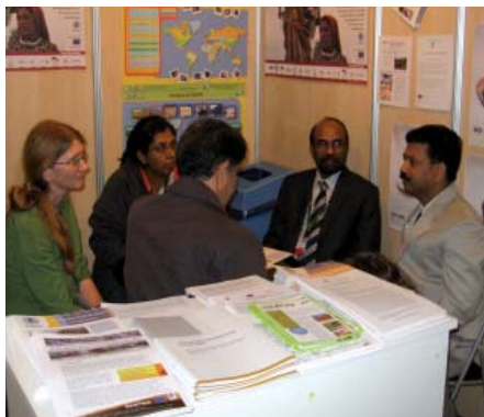
Visit of the Indian Focal Point to the Drynet info stand at the CRIC7.