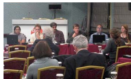
Drynet members during Side Event on "Pastoralism in Dryland Areas"

деле преодоления деградации земель». Кроме того, они представили новые публикации для практического использования и для обсуждения. Это такие публикации, как «Роль организаций гражданского общества в управлении засушливыми землями – Практическое руководство для планирования, классификации и анализа уровня общественного и политического участия», изданная совместно проектами «Драйнет» и «Глобальный Механизм», а также меморандум «Драйнет» «Бурный рост производства биотоплива и его последствия для засушливых земель». Все эти публикации теперь доступны на нашем сайте. Хотя организации, представляющие гражданское общество, имеют возможность открыто участвовать в таких мероприятиях, вопрос заключается в том, какое конкретное влияние они могут оказывать на процессы принятия решений. Данный бюллетень предлагает вниманию читателей некоторые точки зрения, существующие по этому вопросу, и пытается прояснить,