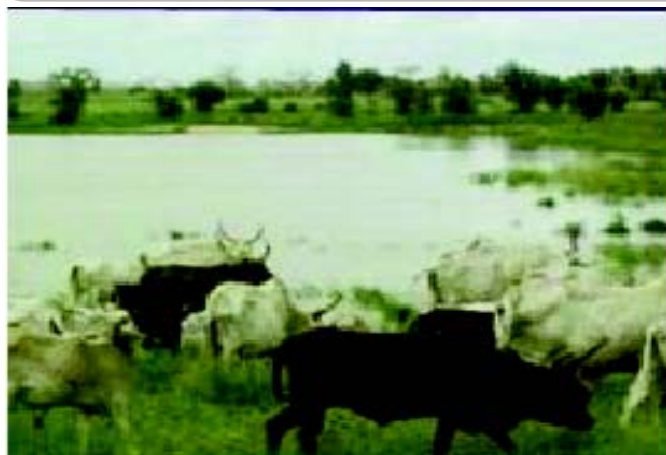
Bassin de rétention (stockage de l'eau de ruissellement promotion de l'agriculture familiale, de l'élevage et régénération de l'environnement

Il faudra également mener des analyses supplémentaires pour mieux comprendre la faisabilité de l'adaptation aux effets des impacts des changements climatiques, les coûts réels des interventions, et leur valeur ajoutée par rapport à l'inaction. Les résultats du quatrième rapport du GIEC, le rapport Stern et les résultats à venir du Programme de Travail de Nairobi devraient servir de guide.