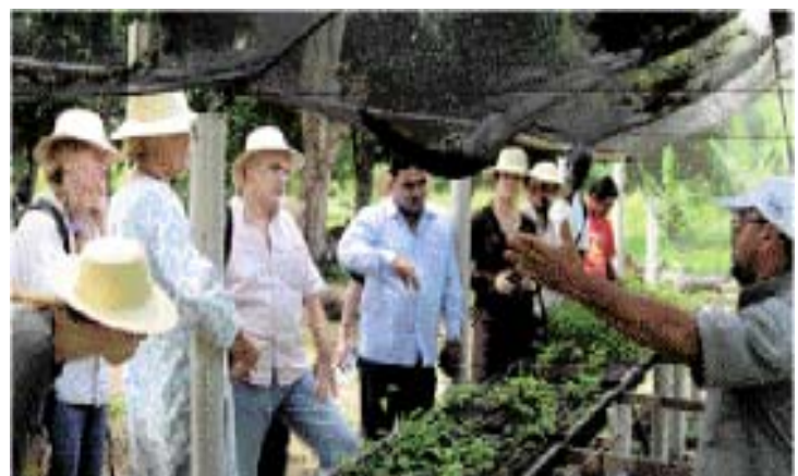
Drynet partners visiting the Brazilian drylands

One of the ongoing activities at this moment concerns "mapping". Drynet-partners are mapping Civil Society Organisations (CSOs) on a national level, creating a clear overview of the different local organisations working on dryland issues. This overview will provide the basis to both strengthen net-works and to build capacities. In addition, the so-called "Financing Partners", consisting of the donor community and coordination, will also be "mapped". If your organisation is working on issues, concerning drylands, you and Drynet can be an added value for each other. So please do not hesitate to get in contact with us!