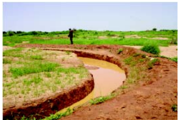
Technique de demi lune (lutter contre l'érosion hydrique des sols, favoriser la recharge de la nappe)

- enfin, le dernier problème noté à ce niveau est lié à la faible capacité d'influence des PMA au sein du conseil d'administration du FEM.