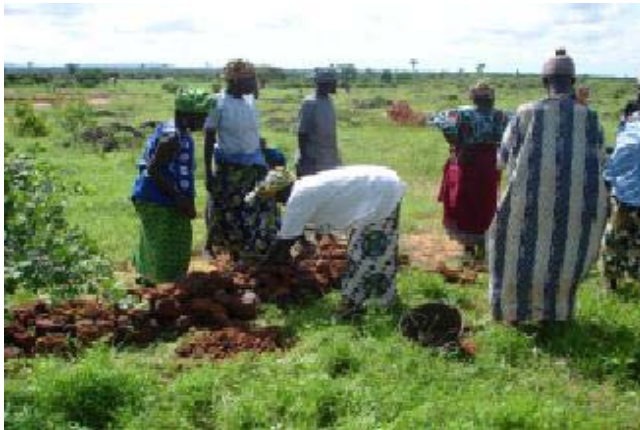
Pose de cordons pierreux par les villageois de Lambou pour lutter contre l'érosion des sols

*«EDER Niger, JVE Togo, TENMIYA Mauritanie, GERED Burkina Faso, AMADE PELCODE Mali, UNO TACAL Guinée Bissau, ERA Cameroun, RAC France, Equiterre Canada, ENDA Sénégal, CONGAD Sénégal, FAPAL Sénégal, Amis de la Terre, France».